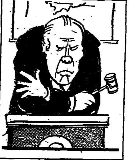
تورد .. الحملة الصهيونية تجنبت

وكان يبدو ، كان لحرب ١٩٧٢ أثرها على العملية اليهودية الأمريكية أيضا لا يبرح سرا . ان هذه الجالية واقعة في أزمة منذ الحرب . فقد تضعضق أيمانها الصهيوني بقوة دولة إسرائيل وغيرها على العيش بيوها الذاتية ، ولم تعد إسرائيل هوية لوقت الفراغ تتكفل التليل من المال نسبيا وتخلق الكثير من الفقر .